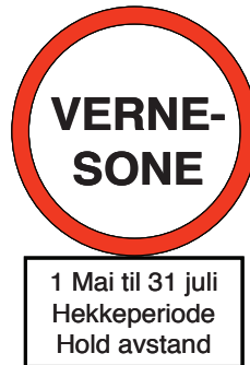
Eksempel på forbudsskilt.

Ved alle hovedinnfartsveger til skyte- og øvingsfeltet er det satt opp informasjonstavler.