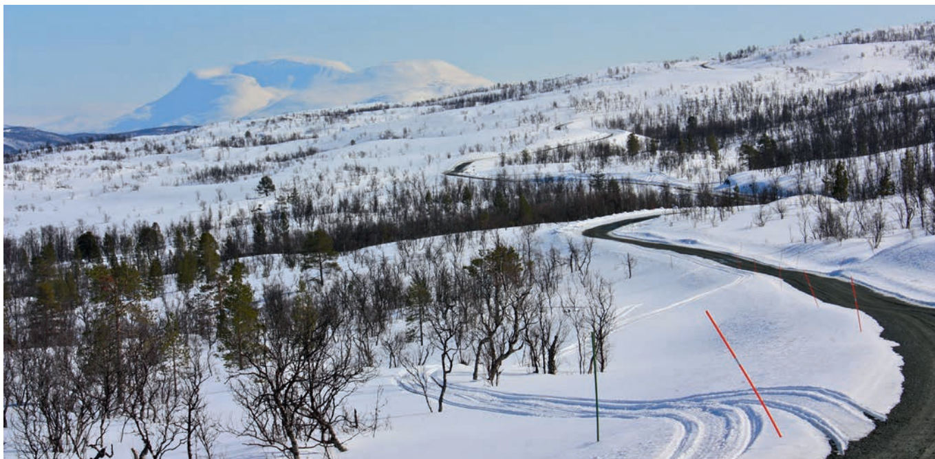
Sammenbindingsveien mellom Mauken og Blåtind er tilpasset terrenget for å redusere inngrepet mest mulig.