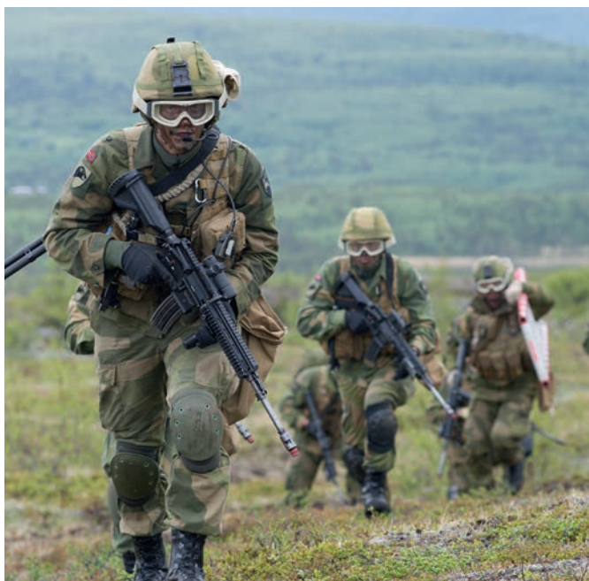
Soldater fra Brigade nord trener i Mauken.

Oppdraget om flerbruksplanlegging for skyte- og øvingsfeltene er gitt i Stortingsmelding nr. 21 (1992-93) "Handlingsplan for miljøvern i Forsvaret". I meldingen understrekes at de faste skyte- og øvingsfeltene skal dekke de primære behov for utdanning og trening og er Forsvarets viktigste "klasserom". Feltene er viktige grunnlagsinvesteringer og en del av Forsvarets infrastruktur.