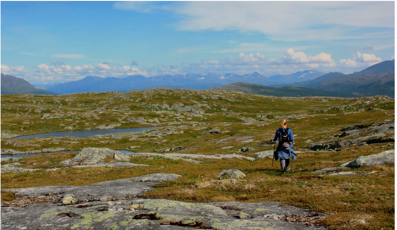
Alle kan dra på tur i feltet.