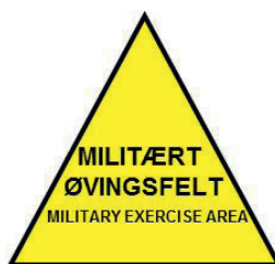
Skilt rundt sammenbindingskorridoren og tilsvarende øvingsområder.

I Sammenbindingskorridoren foregår det ikke skarpskyting, men det øves med løsammunisjon, markeringsmidler og kjøretøyer, både på og utenfor vei. Dette og tilsvarende områder er merket med "Militært øvingsfelt".