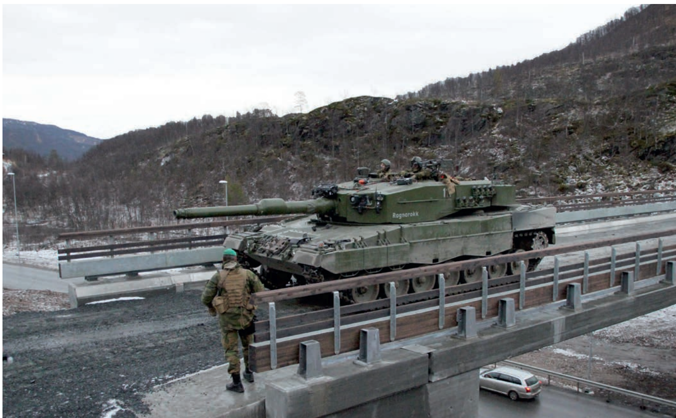
Stridsvogn krysser brua over E6.

Ved begravelser på Vassmo kirkegård skal Forsvaret, på anmodning fra kirkekontoret, innstille all støyende aktivitet i feltet.