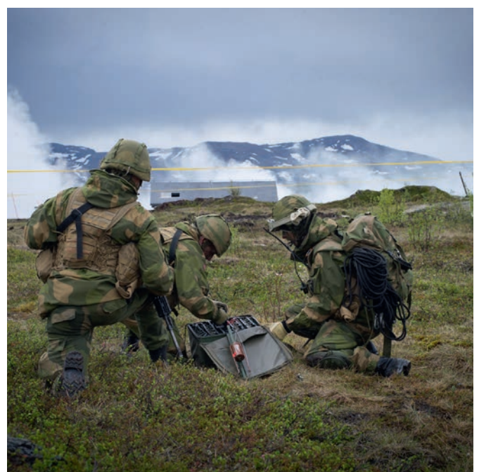
Mange ulike avdelinger trener i feltet.

Innenfor øvingsområdene gjelder hundelovens generelle regler. I tillegg gjelder kommunale bestemmelser. Kontakt kommunen for nærmere informasjon.