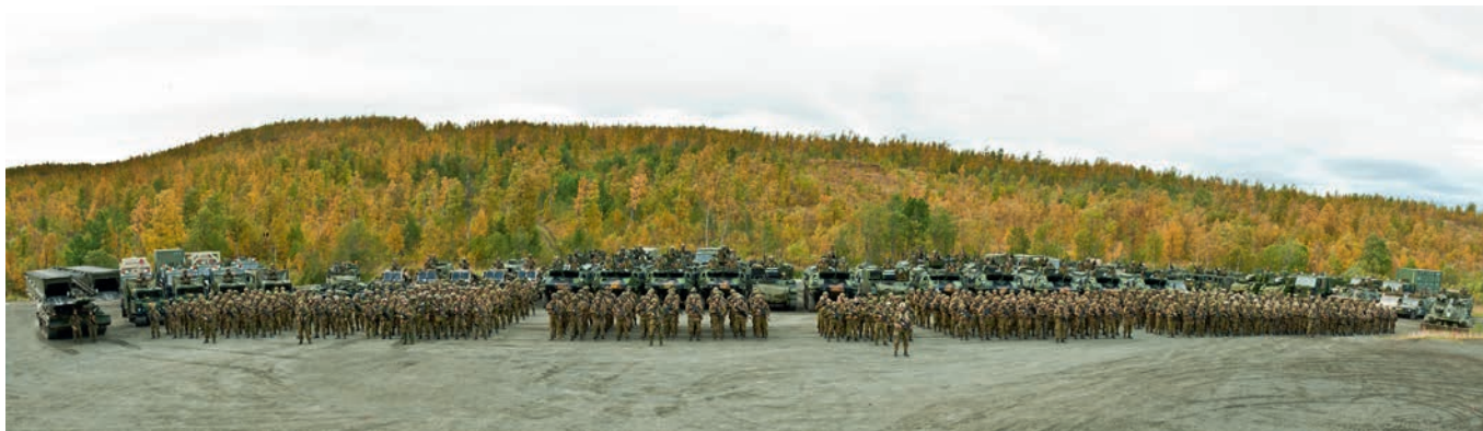
Det kan være mange soldater på en gang i området. Her er 2.Bn oppstilt på Akkaseter.