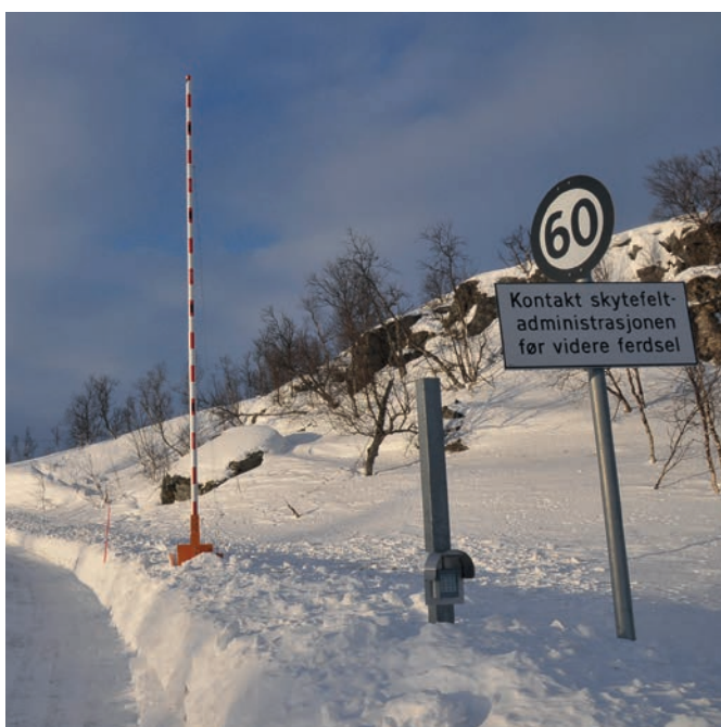
Veiene i feltet er ikke åpne for allmenn motorferdsel.

Forsvaret ønsker at tradisjonelt friluftsliv, herunder sopp- og bærplukking, skal kunne utøves innenfor skyte- og øvingsfeltet, forutsatt at aktivitetene ikke er til ulempe for Forsvarets virksomhet. Utøvelsen må også ta hensyn til biologisk mangfold og kulturminneinteresser.