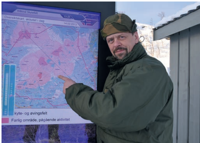
Elektroniske informasjonstavler viser aktivitet som pågår.

Ved feltets hovedinnfartsveier er det satt opp informasjonstavler/skilt med kart og/eller annen viktig informasjon. Utforming, størrelse og mengde informasjon avhenger av veiens bruksomfang.