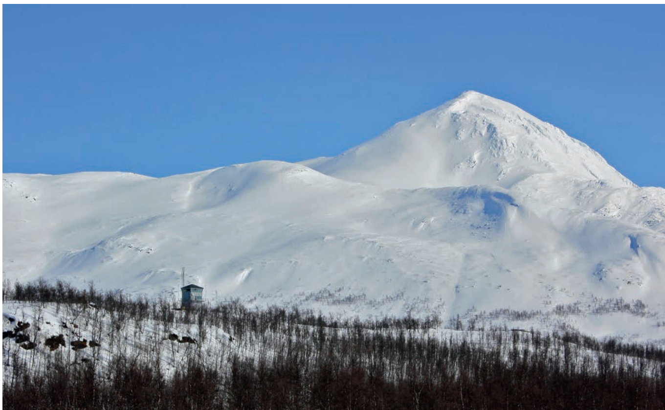
Blåtind med skyteledertårn.

Tyngden av anlegg for skarpskyting er i Blåtind konsentrert til de vestre og nordvestre deler, med basis i Akkaseter og Skardalen/Mårfjellskaret. I dette området skytes det med alle typer håndvåpen og infanteriets tyngre støttevåpen samt feltartilleri, stridsvogner og stormpanservogner. Øst i feltet og fra Mauken skytes det tidvis med feltartilleri inn mot samme målområder. I de indre deler av Blåtind, rundt Blåtindan og Slettfjellet, er et areal på omkring 50 km 2 avsatt som nedslagsfelt for eksplosive prosjektiler. For øvrig brukes feltet til trening og øvelser.