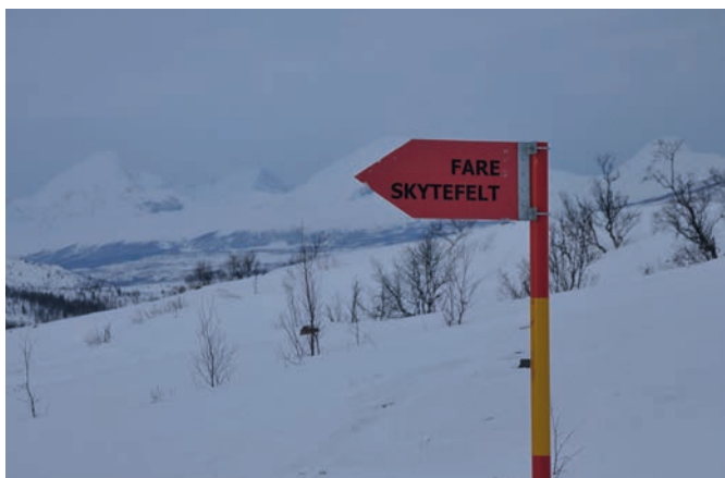
Yttergrensene på feltet er merket.

Skiltene er satt opp med ca. 50 meters mellomrom rundt hele yttergrensen, med unntak av bratte fjellskråninger som er tilnærmet utilgjengelig. Skiltene peker inn i feltet. Skiltene er montert på røde stålrør med gule bånd. Der grensa går igjennom skog er det ryddet gater på ca. 6 meters bredde for at det skal være sikt mellom skiltene. Dersom det er skyting i feltet kan det være forbundet med fare å ferdes innenfor skytefeltgrensen. Innenfor skytefeltet kan forurenset grunn og vann påtreffes.