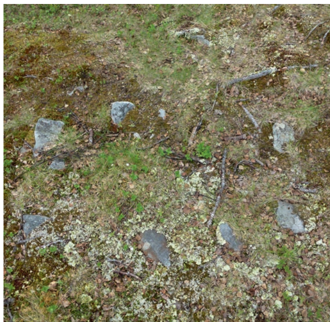
Arran (ildsted). Et typisk samisk kulturminne i Mauken.

Allmennhetens bruk skal heller ikke medføre konflikt med kulturminneinteresser.