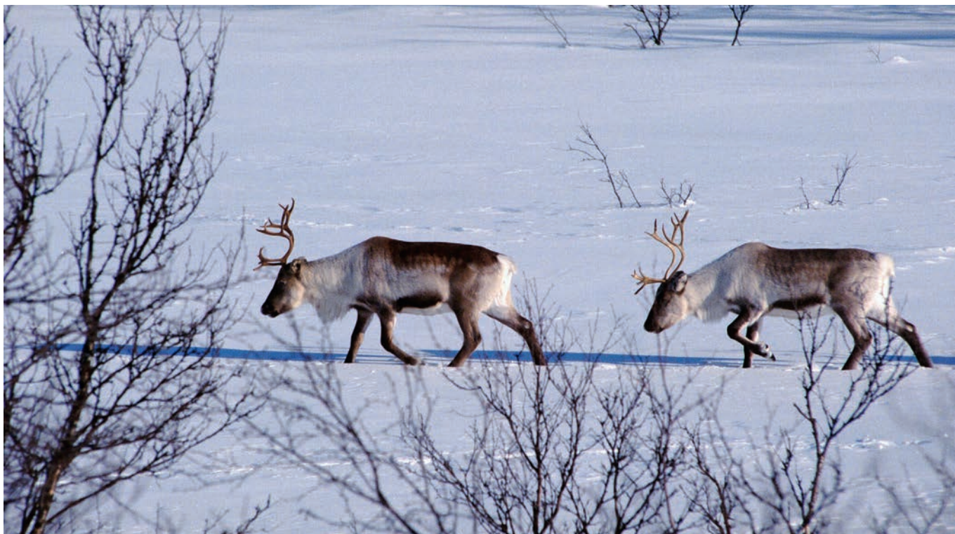
Mauken-Blåtind er både øvingsområde for Forsvaret og vinterbeite for rein.