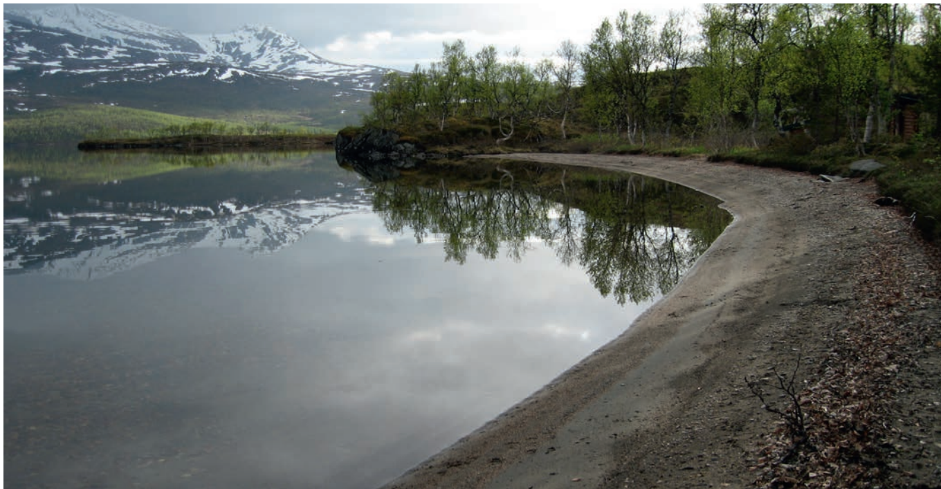
Strandsonen rundt Takvatnet er skjernet for militær aktivitet.