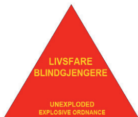
Skilt rundt nedslagsfelt.

Nedslagsfeltet er merket med "Livsfare blindgjengere". Skiltene er satt opp med ca. 50 meters mellomrom rundt hele nedslagsfeltet, med unntak av bratte fjellskråninger som er tilnærmet utilgjengelig. Skiltansiktet er rettet ut av feltet. Skiltene er montert på impregnerte trestolper med røde bånd. Der grensa går igjennom skog er det ryddet gater på ca. 6 meters bredde for at det skal være sikt mellom skiltene. Innenfor nedslagsfeltet er det fare for blindgjengere. Ferdsel i dette området kan derfor medføre livsfare selv om det ikke er skyting i feltet. Ammunisjonsrester og andre gjestander MÅ IKKE RØRES. Ferdsel frarådes.