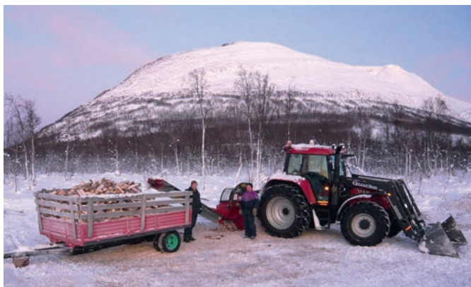
Skogsdrift i Skardalen.

I Blåtind kan det drives beitebruk med sau og ungfø innenfor gjeldende rettigheter. Ved behov foretas tilpassinger mellom Forsvarets øvelser på den ene side og tilsyn med eller sankning av beitedyr på den annen side.