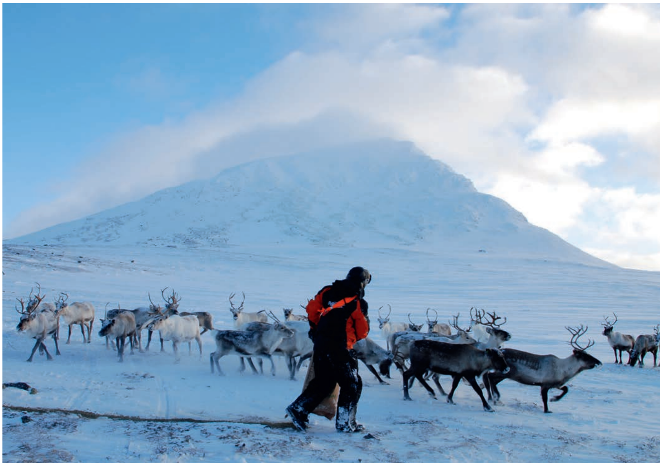
Foring av rein i Mauken.